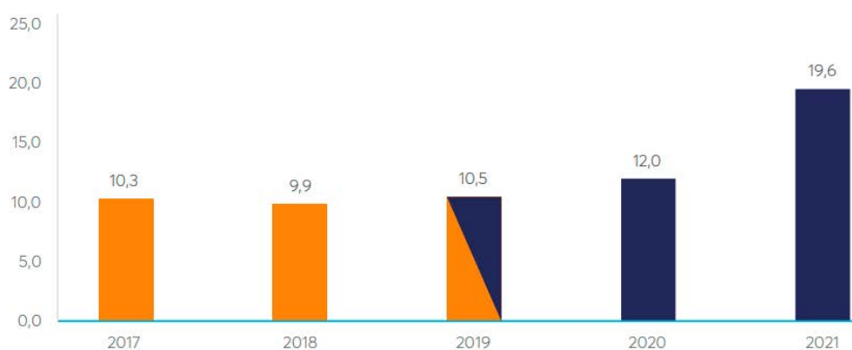
Γράφημα 12. Ο συνολικός αριθμός των άρθρων των τροπολογιών που ψηφίστηκαν ανά νόμο (2017-2021).

Πηγή: ΚΕΦΙΜ, Δείκτης Ποιότητας Νομοθέτησης 2021