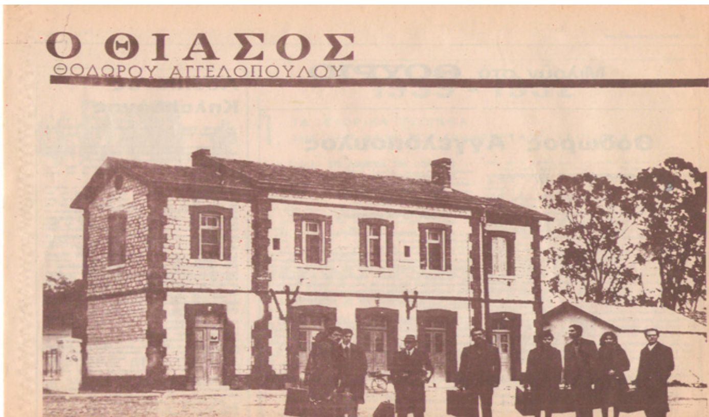
Θούριος 1975- Αφιέρωμα στο Θίασο του Θ. Αγγελόπουλου