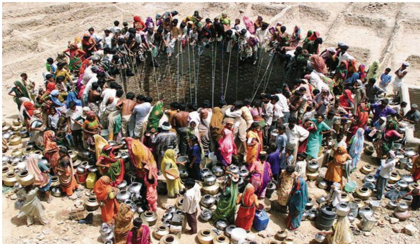
Κάτοικοι του χωριού Natwarghad, της περιοχής Gujarat της Ινδίας, συγκεντρώνονται γύρω από ένα μεγάλο πηγάδι για να πάρουν νερό.