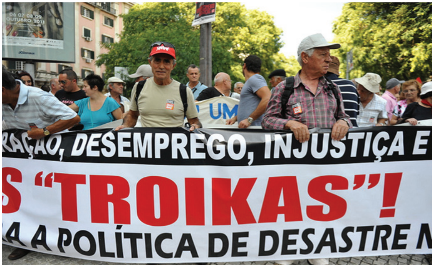
Διαδήλωση στην Πορτογαλία, ενάντια στα μέτρα λιτότητας